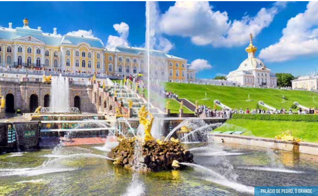
PALÁCIO DE PEDRO, O GRANDE